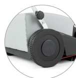
Roues arrières de grand diamètre