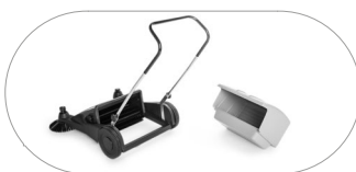
Conteneur déchets de grande capacité