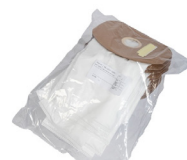
Sacs poussière microfibre (lot de 10)