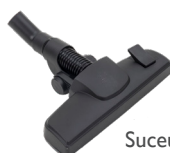
Suceur sols mixte ECO