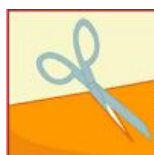
A la coupe