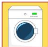
Lavable en machine