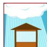
Extérieur sous abri