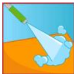
Jet haute pression